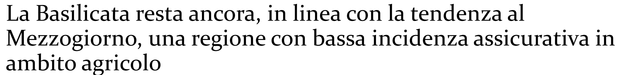
TAB 2.4 - VALORI ASSICURATI PER REGIONE NEL 2017 - COLTURE VEGETALI